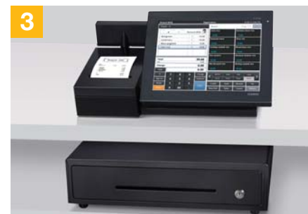
Lisävarusteena saatava kassalaatikko voidaan asentaa erilleen itse pääteestä, mikä edesauttaa laitteiston sopimista tilaan kuin tilaan.