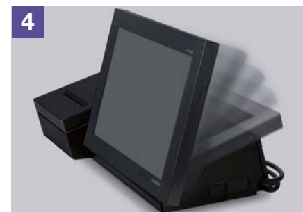
Helppokäyttöinen ja tyylikäs kosketusnäyttö sekä moottorikäyttöinen näytön kallistuksensääätömekanismi.