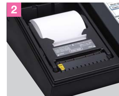
Integroitu lämpökirjoitin, joka pystyy käyttämään sekä 58 mm:n että 80 mm:n lämpökuittinauhaa.