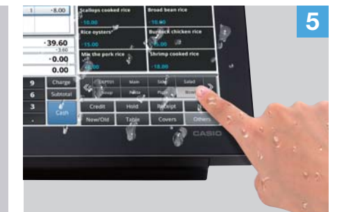
Kosketusnäyttö täyttää IPX2-roiskevesikestävyysvaatimukset. Sitä voidaan käyttää jopa märin käsin.

V-R100 päätteen skaalautuvuus on omaa luokkaansa. Se mahdollistaa järjestelmän kehittämisen helposti tulevaisuudessa.